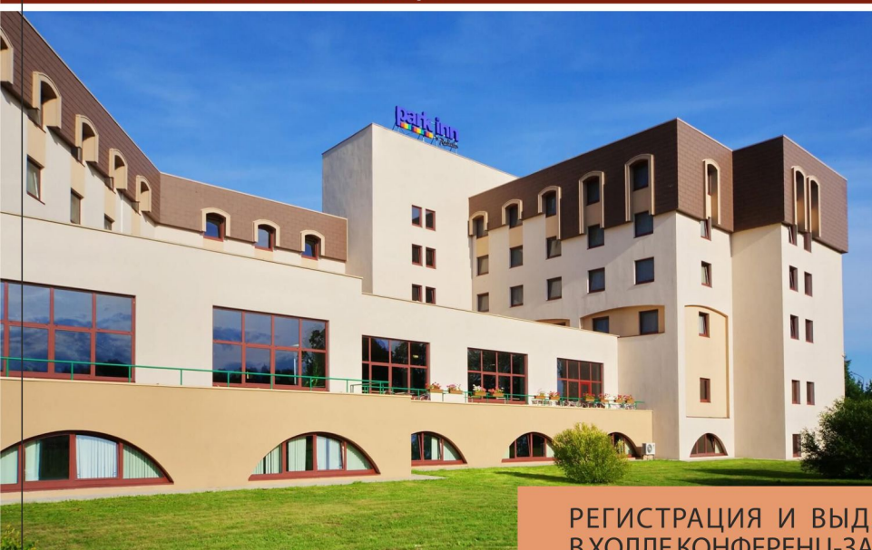
ОТЕЛЬ ПАРК ИНН конференц-зал «АБ» (Студенческая ул., 2)